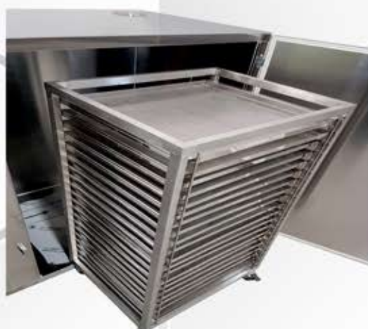
WÓZEK DO SUSZENIA PYŁKU 09-1-W