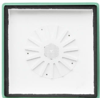
(h) mating box nucleu de imperechere