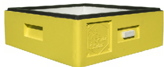
(d) box/body corp