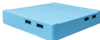
(g) bee escape seperator cu gauri ptr albine